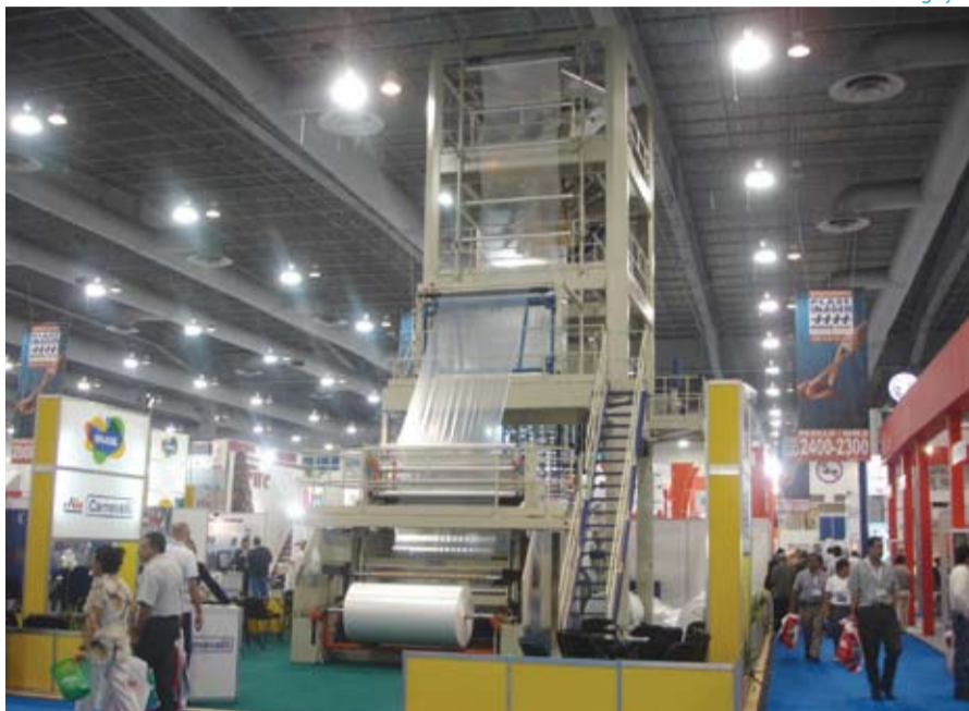
Stand de Carnevalli en la 15ª Plastimagen, realizada en México

Durante el primer semestre, Carnevalli he participado de tres importantes ferias en Europa y América Latina para divulgar sus equipos y fortalecer su marca.