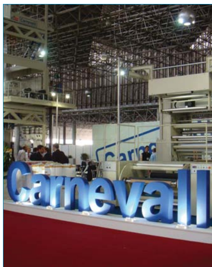
Vista general del stand de Carnevalli en la 6ª Brasilpack.

Para satisfacer las necesidades de un mercado cada vez más exigente, Carnevalli presentó la Amazon High Tech 8 colores en el evento.