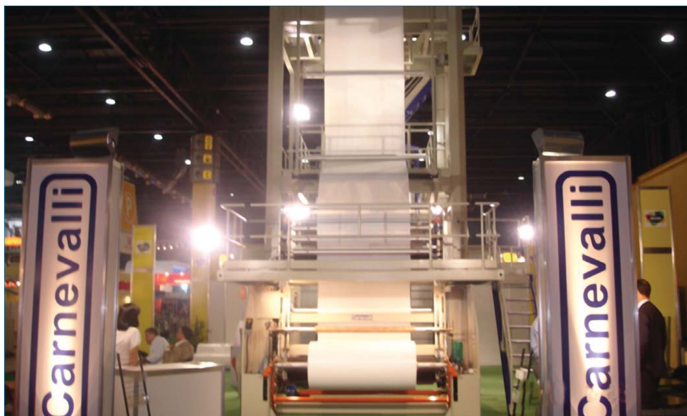
Extrusora Monocapa Polaris Magnum 75