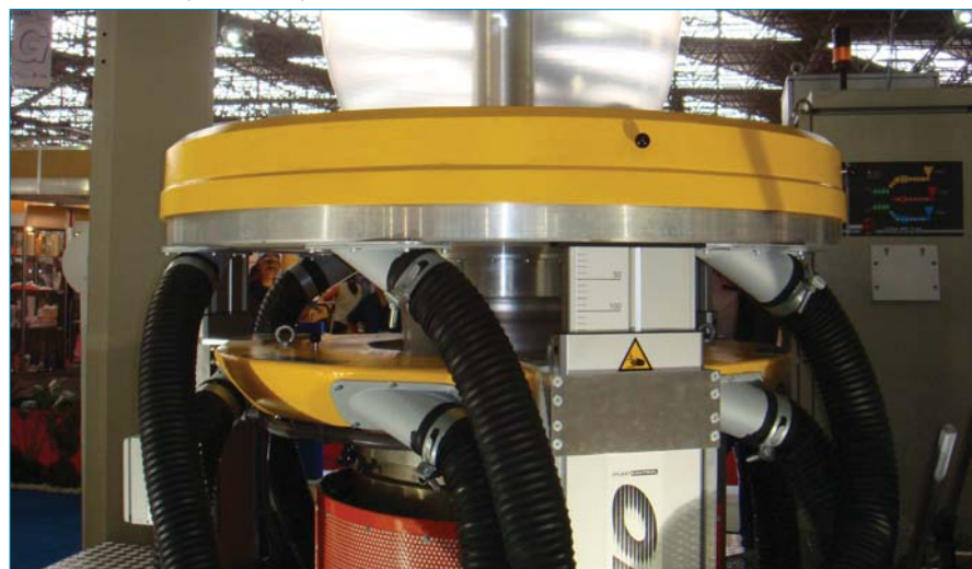
Detalles del Doble Anillo de Aire

El motor reductor directo con acoplamiento elástico, eliminando otras transmisiones, reduce el consumo de energía en hasta 10%.