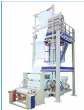
Línea de Extrusión para películas de alta y baja densidad POLARIS-MAGNUM 60-1600