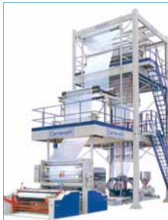
Línea de Extrusión configurada para películas de alta densidad, POLARIS-MAGNUM 75-2000