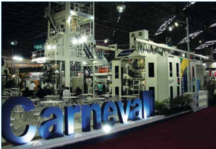
Estande de Carnevalli en Brasilplast 2007

Carnevalli presenta su alta tecnología para el mercado en uno de los mayores eventos del sector