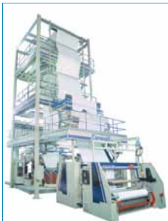
Línea de Coextrusión de 3 capas da familia POLARIS 3 PO

IMPRESORA FLEXOGRÁFICA DE TAMBOR CENTRAL, 8 COLORES- AMAZON8-1200 HT , con plena gestión por CLP y IHM, grupos impresores accionados por motores de paso con husillos a bolas recirculante y guías lineales, registros motorizados y sistema para cambio on-board de las mangas, lo que permite una gran flexibilidad y reducción de la puesta en marcha, muy importante debido a la tendencia creciente de tiradas cortas y diversas.