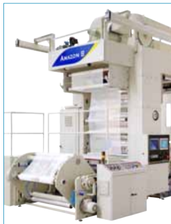
Impresora Flexográfica de 8 colores, AMAZON 8-1200 HT