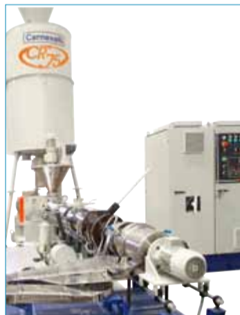
Línea de Reciclaje CR-75