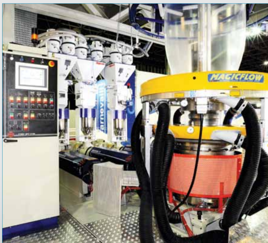
Doble Anillo de Aire

Este sistema facilita el mantenimiento remoto de las máquinas, controlado por CLP permite visualizar la temperatura, la presión, la rotación, la formulación, el espesor de la película, la producción, entre otras funciones.