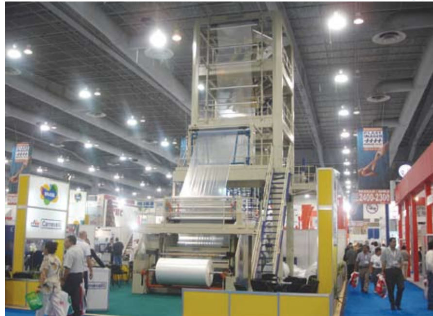
Estande da Carnevalli na 15ª Plastimagem realizada no México

Durante o primeiro semestre, a Carnevalli participou de três importantes feiras na Europa e América Latina para divulgar os equipamentos e fortalecer sua marca.