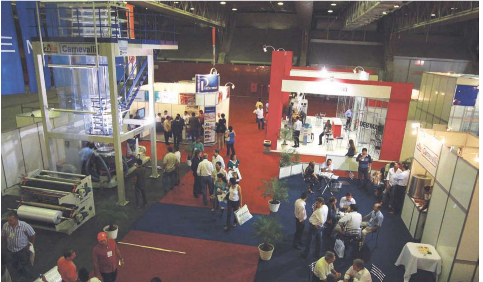
A Carnevalli apresentou a extrusora de 60 mm para um público de mais de 12 mil pessoas na 3ª Embala Nordeste - Feira de Embalagens e Processos, entre os dias 18 e 21 de agosto, em Pernambuco. PÁGINA 3